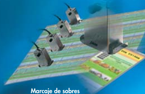
Marcaje de sobres