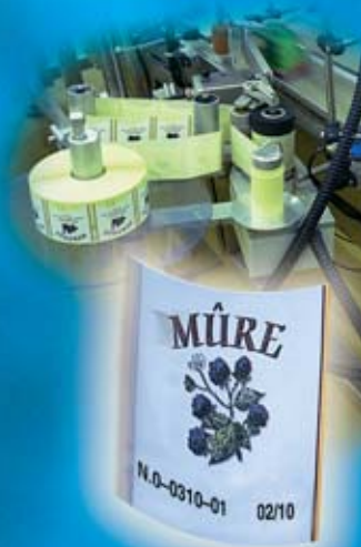
Marcaje de etiquetas