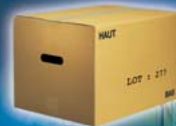
Marcaje de cajas