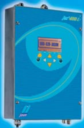
Pupitre jas 400i (de 1 a 4 cabezales)