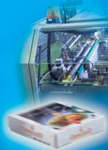
Marcaje de estuches