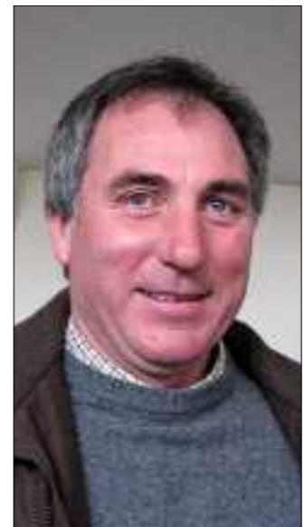
Le maire de Moulins-sur-Céphons réagit.

« Pour moi, ce n'est pas un problème de santé publique mais de vengeance politique. La plupart des membres de l'ADQV ne sont pas originaires de la commune, ils ne s'occupent que de leurs intérêts individuels et pas des riverains. »