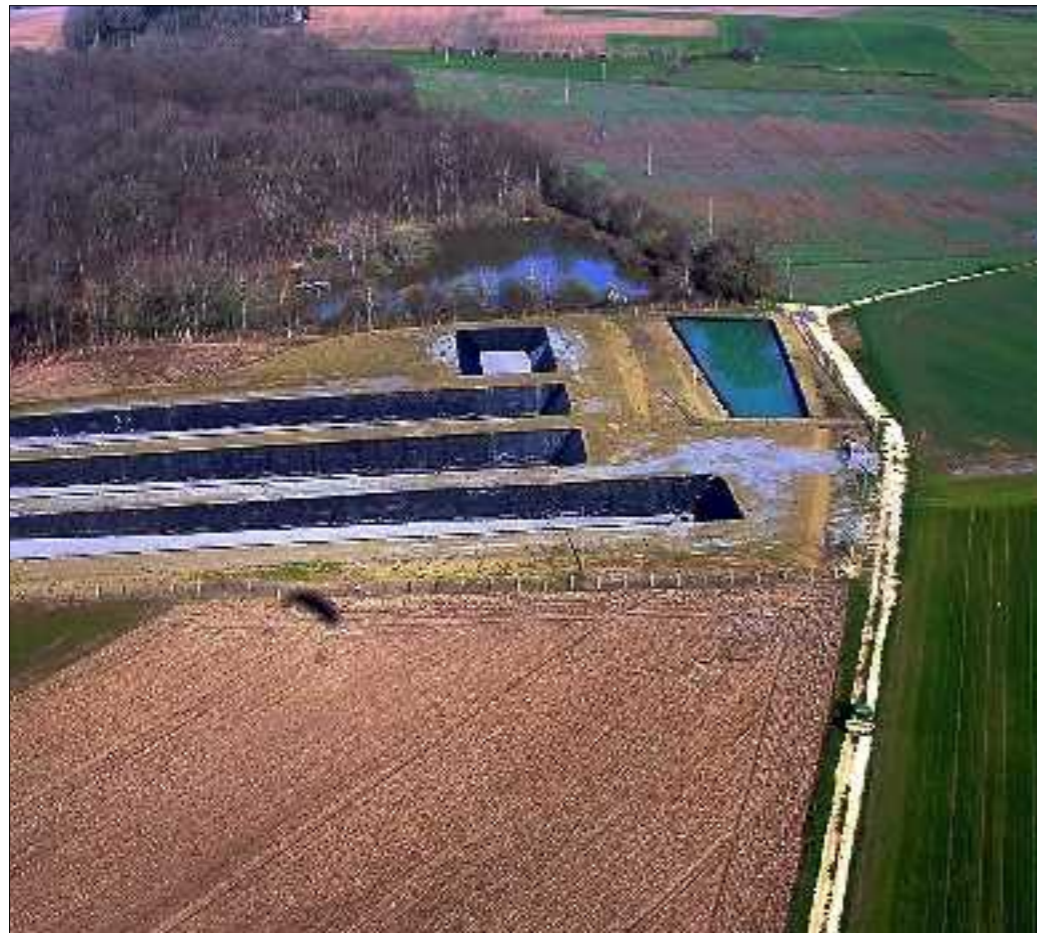
Le site de confinement, basé à Moulins-sur-Céphons, vu du ciel.

Un rassemblement a eu lieu, samedi, à Châteauroux pour sensibiliser la population sur le problème du chrome dans la rivière Céphons. Le confinement sur site est contesté. Or, les travaux de curage débuteront cet été.